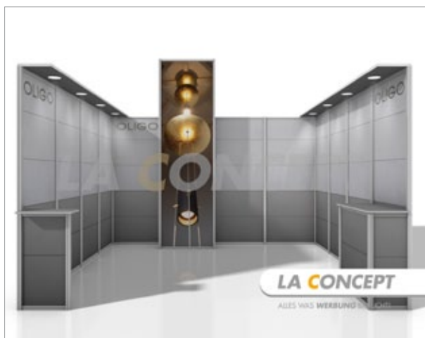
Erste 3D Visualisierung des OLIGO Lichttechnik Messesystems